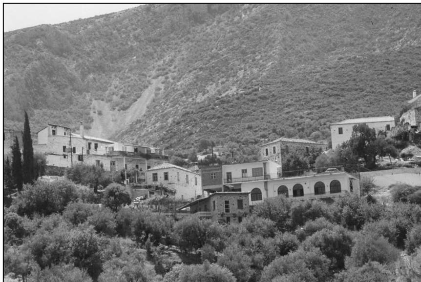
Τυρός, Κυνουρίας, Αρκαδίας

1 Αιτωλίας και Ακαρνανίας, 2 Αττικής, 3 Ευρυτανίας, 4 Ευβοίας, 5 Φωκίδος, 6 Φθιώτιδος, 7 Πειραιώς, 8 Βοιωτίας, 9 Αχαΐας, 10 Αργολίδος, 11 Αρκαδίας, 12 Ηλείας, 13 Κορινθίας, 14 Λακωνίας, 15 Μεσσηνίας, 16 Κεφαλληνίας, 17 Κερκύρας, 18 Λευκάδος, 19 Ζακύνθου, 20 Καρδίτης, 21 Λαρίσης, 22 Μαγνησίας, 23 Τρικάλων, 24 Άρτης, 25 Ιωαννίνων, 26 Πρεβέζης, 27 Θεσπρωτίας, 28 Δράμας, 29 Φλωρίνης, 30 Γρεβενών, 31 Χαλκιδικής, 32 Ημαθίας, 33 Καστορίας, 34 Καβάλας, 35 Κιλκίς, 36 Κοζάνης, 37 Πέλλης, 38 Πιερίας, 39 Σερρών, 40 Θεσσαλονίκης, 41 Έβρου, 42 Ροδόπης, 43 Ξάνθης, 44 Δωδεκανήσου, 45 Χίου, 46 Κυκλάδων, 47 Λέσβου, 48 Σάμου, 49 Χανίων, 50 Ηρακλείου, 51 Λασιθίου, 52 Ρεθύμνης.